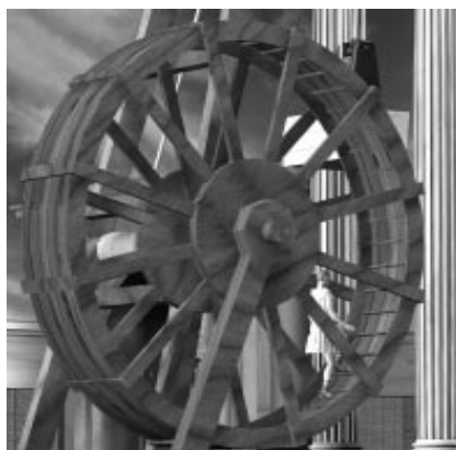
Gru calcatoria : simulazione virtuale del funzionamento (progetto IMSS)