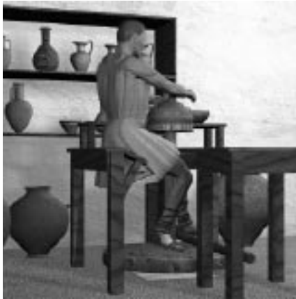
Tornio e vasaio