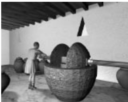
Macina da cereali