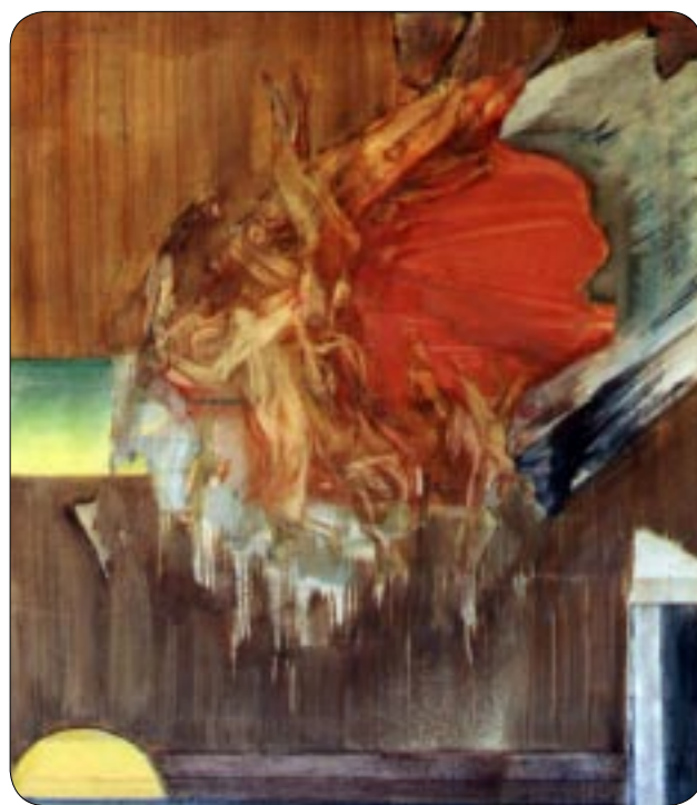
W. Sertürner: Apokalypse, 1979 - Olio su tela

wird zusammen mit anderen Bildfragmenten, Flächen, Linien - montageartig oder collageartig - verbunden. Ein weiteres Moment - auch in den Bildern der 80er Jahre abzulesen. Es können Tiefen eingebaut werden, aber sie müssen in das Bild eingebunden sein. Wernhera Sertürner zitiert dazu: "Es geht quasi um das Schwingen in einer Raumscheibe, alles wird an die Fläche gebunden". Es geht also nicht um Vordergrund/Hintergrund,