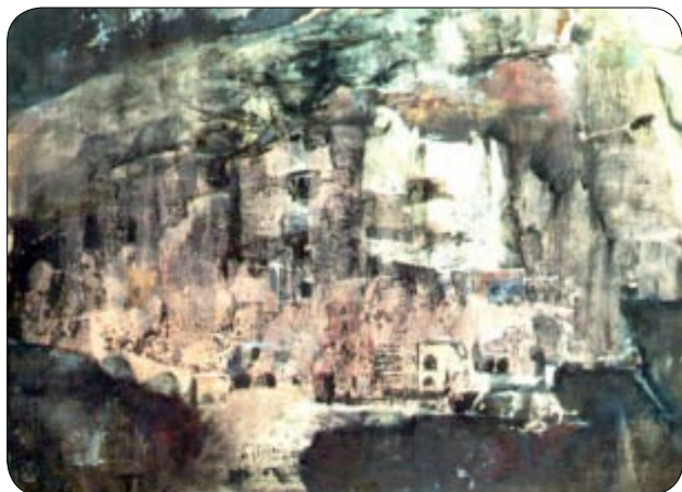
W. Sertürner - Ischia (1970, Tempera su cartone, 44x62cm)