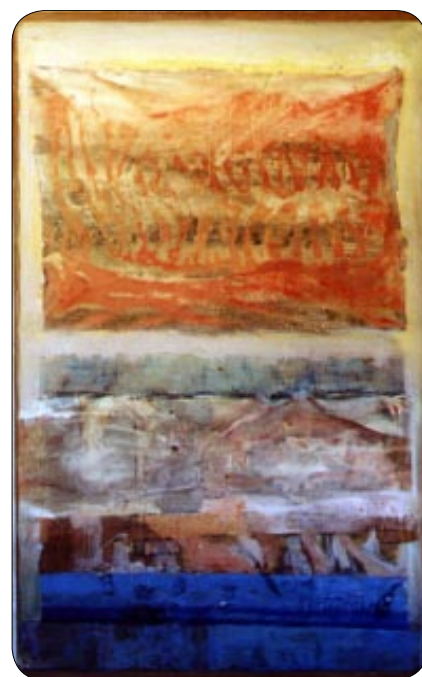
W. Sertürner - Strisce 1962, olio su tela

Il risultato: composizioni di strutture le più svariate. Innanzitutto i "quadri a strisce", cioè il risalto delle forme orizzontali, poi il conseguimento delle forme verticali tramite "l'ausilio" delle colonne. Colori e tracce delle colonne ricordano gli anni ischitani. Questi lavori hanno ancora titoli specifici, ai quali Wernhera Sertürner rinuncerà nel 1992. Titoli di aiuto all'osservatore: "Fragmente einer Perspektive" (Frammenti di una prospettiva), "Das imaginäre Museum" (Il museo immaginario), "Im Namen des Humanismus" (Nel nome dell'Umanesimo), "Apokalypse" (Apocalisse), "Vertreibung" (Espulsione), "Torso in Mauer" (Torso sulla parete)... Si tratta di figurazioni, di riconoscibilità. Si possono vedere paesaggi, ritratti.... Ma non si tratta di dipinti di paesaggi o di ritratti. Entrambe le cose vengono solo citate nel quadro, ad esempio attraverso la rappresentazione del quadro nel quadro. Il quadro rappresentato come citazione (tra l'altro un ritratto) è collegato con altri frammenti del quadro,