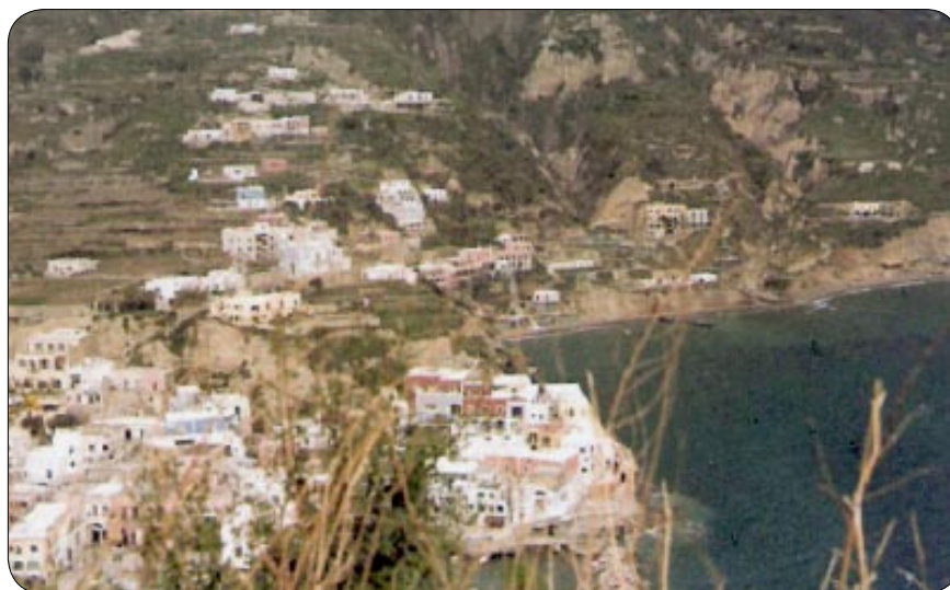
Sant'Angelo 1964

Nel 1994 il figlio Andrea viene aggredito e subisce una grave ferita alla