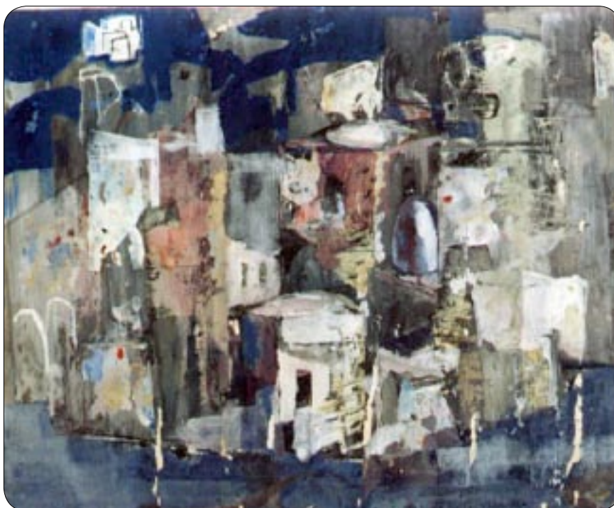
W. Sertürner - Ischia (1970, Tempera su cartone, 44x62 cm)

Im September zieht sie sich eine Oberschenkelhalsfraktur zu, an deren Folgen sie dann am 22. September 2001 verstirbt. Richard Peter schreibt: "Abschied von einer großen Künstlerin."