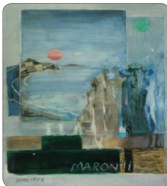
W. Sertürner - Maronti / Ischia (1970, Tempera su cartone)