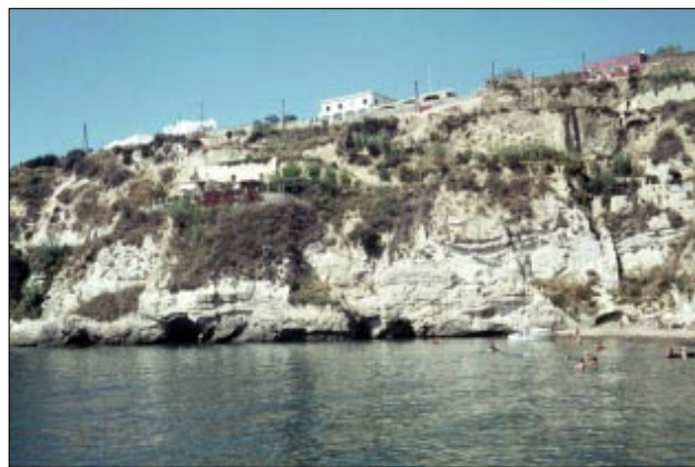
Cavascura - Torre di Sant' Angelo - Costa dell'isola