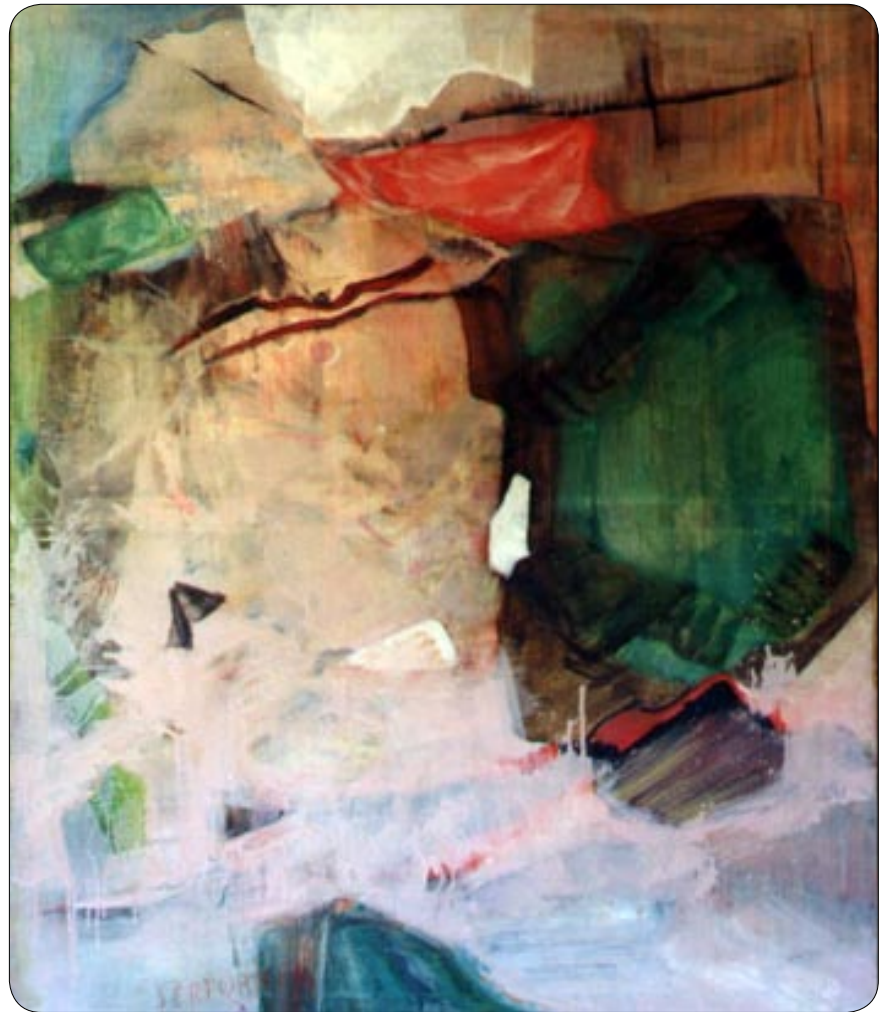
W. Sertürner: ERA 1992 - Olio su tela

Ma in quest'ultimo quadro, questa "impudenza": questo verde, in questa compattezza e concentrazione, in questa misura di piani è catapultato nella parte superiore