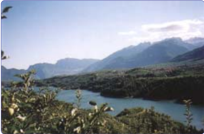
Lago di Santa Giustina