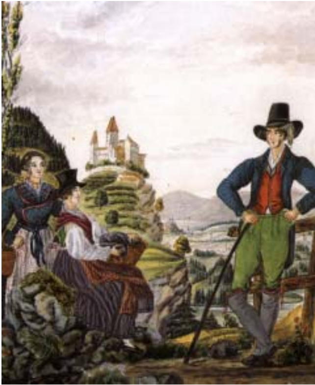
“Castel Cles” (in I costumi popolari del Trentino negli acquerelli di Carl von Lutterotti a cura di Gian Paolo Gri e Chiara San Giuseppe, 1994)