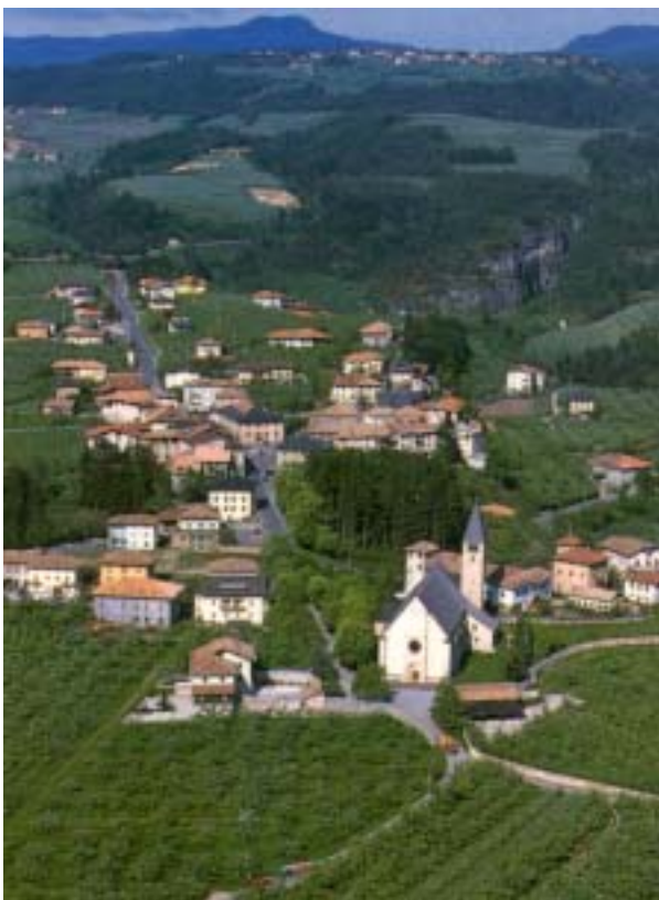
Sanzeno (Trento - Val di Non) Veduta aerea del paese con la Basilica (sec. XV) dei Santi Martiri Sisinio, Martirio, Alessandro