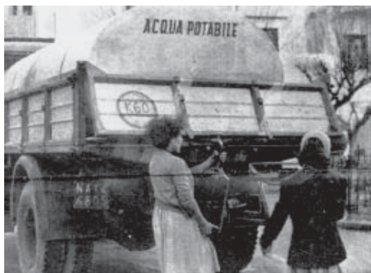
Distribuzione di acqua potabile mediante autobotti

«Nell'anno di grazia 1960, a Ischia, che ha la pretesa di essere isola turistica, anzi sede di villeggiatura ad alto livello, il servizio telegrafico cessa, ogni sera, alle ore 20 per riprendere l'indomani mattina alle ore 9. E i telegrammi in arrivo, e gli espressi, vengono recati al destinatario con la posta ordinaria.