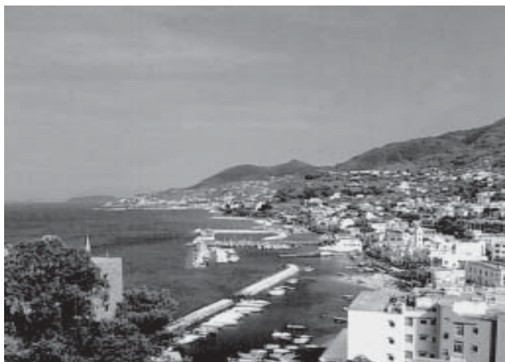
Veduta di Lacco Ameno

Nel marzo del 1980 demmo inizio alla pubblicazione di questo periodico con cadenza trimestrale in una prima fase, poi mensile ed infine (con un certo disappunto) molto vaga e priva di date prestabilite, legata a vari fattori che non è il caso di stare qui a citare: collaboratori e lettori interessati ad esso hanno ben saputo far poco conto della circostanza, conservandoci la loro partecipazione ed il loro consenso.