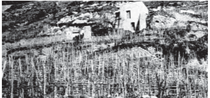
Vigneto con terrazze in pietre di tufo