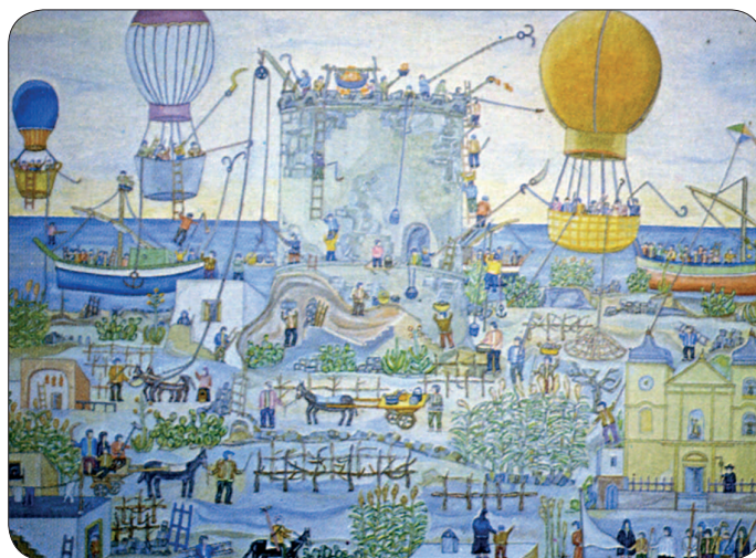
Michele Petroni - Il Soccorso (a sinistra) - Assalto dei pirati (a destra)